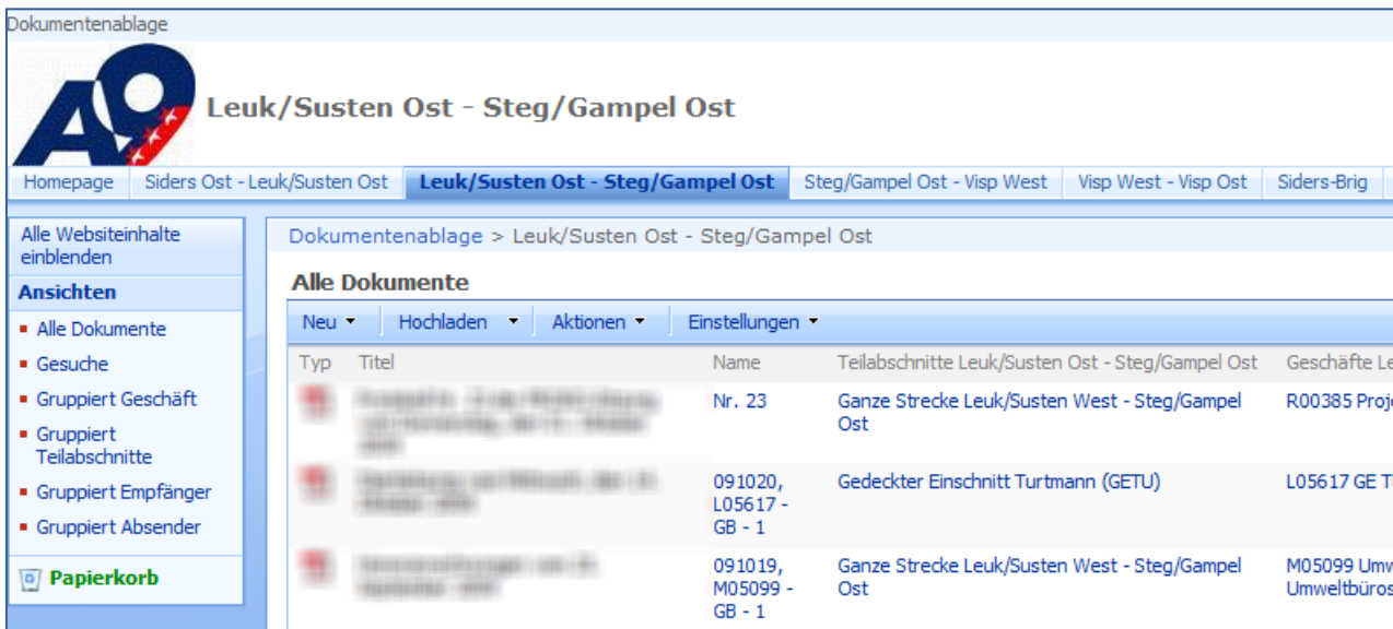
Ausschnitt SharePoint Plattform - Dokumentenmanagement Alle Dokumente werden zentral gespeichert und sind ortsunabhängig jederzeit abrufbar

Eine zentrale Lagerung aller Dokumente erspart der Sektion Nationalstrassenbau SNB viel administrativen Aufwand. Auf Basis von Microsoft Office SharePoint wurde ein Ablagesystem geschaffen. Alle wichtigen Dokumente, wie z.B. externe Verträge, Richtlinien und Belege werden eingescannt und auf der internen SharePoint-Plattform gespeichert. Die Dokumente werden nach Typ und Zuständigkeit geordnet und den entsprechenden Losen zugewiesen. Durch die Kategorisierung nach Metadaten sind Abfragen und Auswertungen über die Volltextsuche problemlos möglich. Alle Mitarbeiter der SNB haben jederzeit und ortsunabhängig Zugriff auf alle Dokumente.